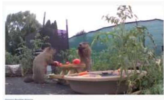
Animals: Russian Bear Sharing Means Caring!