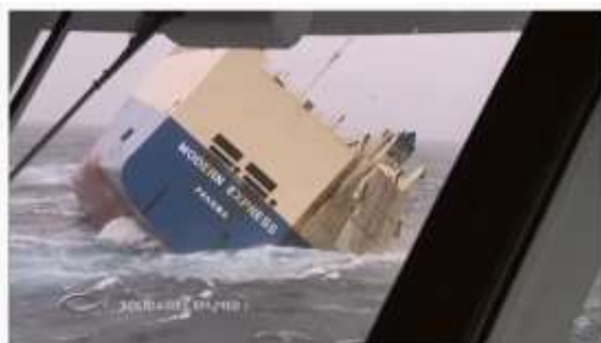
Le sauvetage du Molteni Express - Thalassa (reportage complet)