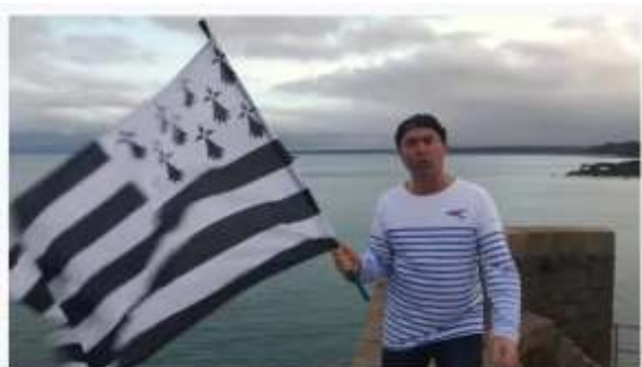
Clip "Le Breton" de Y le Groupe Ajoù (version originale)