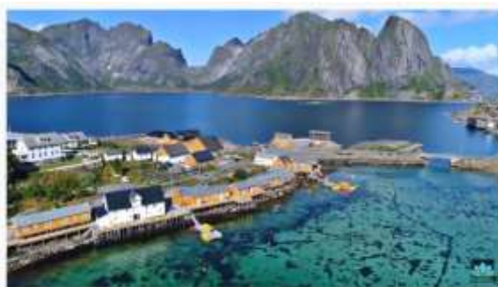
Tubalava voyage en au Norvège, aux Îles Lofoten, filmé par drone + Musique de relaxation