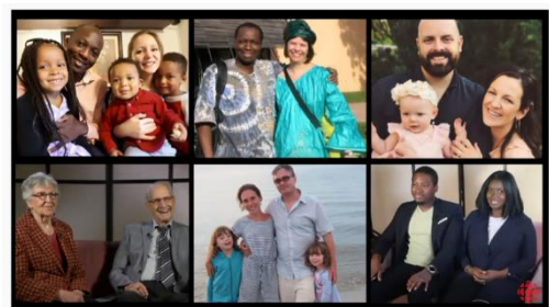
Six couples nous parlent de la francophonie au Manitoba en 2017