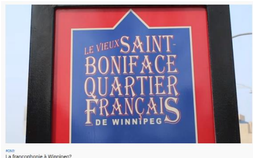
La francophonie à Winnipeg?