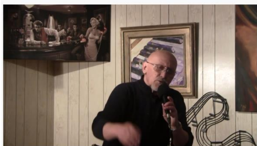
Prendre un ancien par la main.....

Regardez la vidéo en cliquant sur l'image