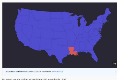
Un avenir pour le cadien en Louisiane? | Francophonie | Rad