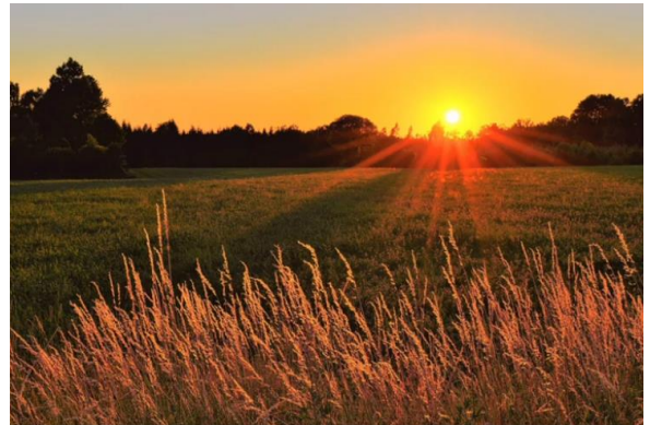
Les Blés au vent - Ave Maria de Giulio Caccini

Si vous avez des suggestions de thèmes ou de sujets pour les vidéos, n'hésitez pas à nous en faire part!