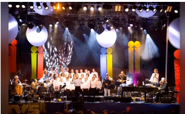
Chanson de la terre – Daniel Lavoie et Les Blés au vent